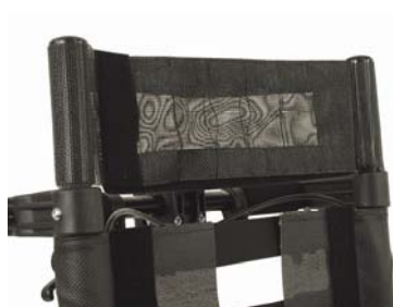
Extension pour dossier hauteur 60 cm