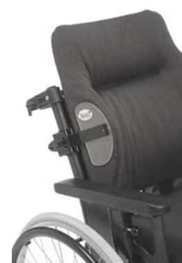
Cale thoracique pour rigidifier davantage les retours latéraux (voir fiche maintien du buste)

Pour toute demande d'information : Tél.: 04-50-27-37-63 infos@eurekamedical.fr